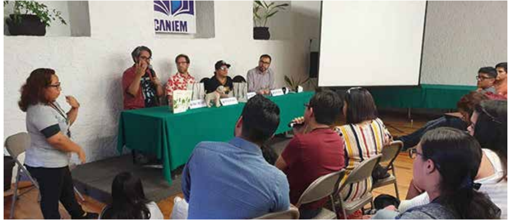
Pláticas con autores, editores e ilustradores fueron parte de las actividades.