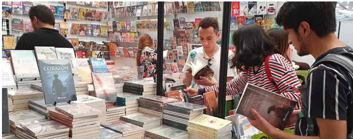
Una gran oferta literaria se pudo encontrar en el Gran Remate de Libros.

La explanada del Monumento a la Revolución se convirtió en un oasis para los amantes de la lectura, quienes en el último día de actividades disfrutaron de conciertos, narraciones orales y presentaciones de libros, además de la amplia oferta editorial.