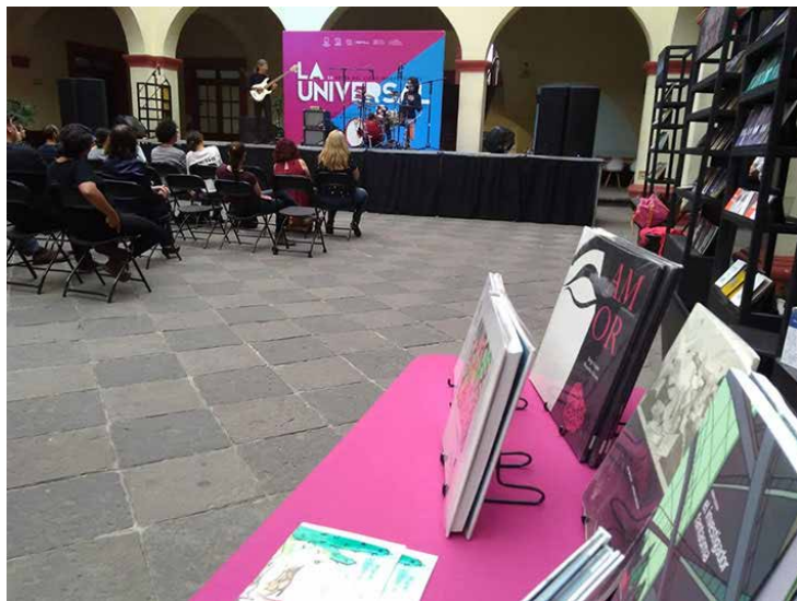
Con buena afluencia se mantuvo la feria.

Cada una de las editoriales independientes presentó sus novedades en alguno de los municipios prioritarios del estado, como Coatetelco, Cuatepec, Cuautla o Jantetelco.