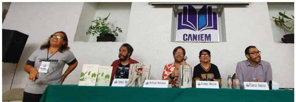
Una gran participación mostraron los invitados a la Quedada.