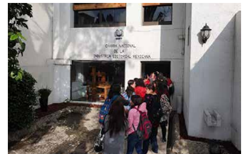
Desde las primeras horas se pudo observar una larga fila para acceder al evento.