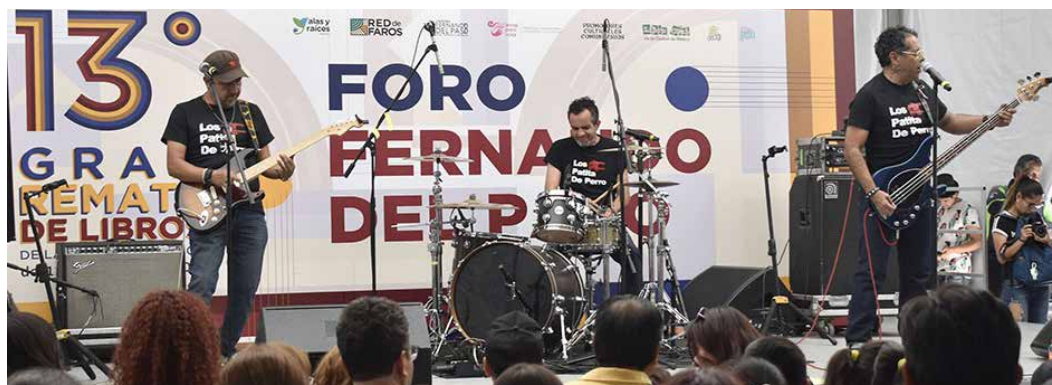
“Los patita de perro” se hicieron presentes durante una de las jornadas musicales.

“Antes identificaba dónde había poesía o los autores que me interesaban, pero ahora la recorrí toda por su nueva distribución para encontrar las mejores ofertas, siempre vengo a ver qué está barato, porque leo muchísimo”, compartió la asidua al Gran Remate de Libros.