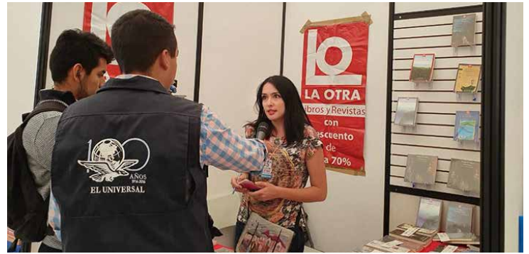
Diversos medios estuvieron presentes durante las diversas jornadas del Gran Remate.

A través del rock infantil, los infantes se acercaron a la importancia de las matemáticas, la problemática migratoria y los feminicidios, entre otros temas. “Los asistentes a las ferias de libros es nuestro público natural, es un público maravilloso al que llegamos por segunda vez en este Remate para celebrar nuestros 25 años de trayectoria”, compartió el baterista.