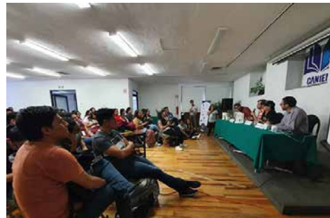
Los jóvenes mostraron su interés y aprovecharon para preguntar a los profesionales de la edición.