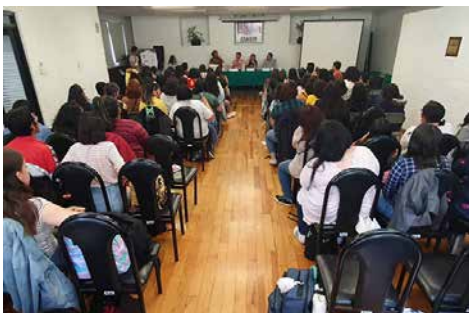
Decenas de jóvenes se dieron cita en las instalaciones de la Cámara.